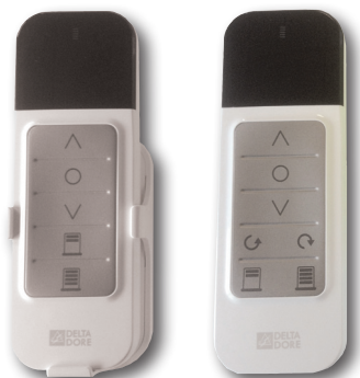
Tyxia 1603 Tyxia 1605

Commandes individuelles permettant l'accès direct aux positions préférentielles (disponible chez Delta Dore)