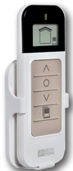
Tyxia 1611 Commande centrale 9 canaux (disponible chez Delta Dore)

* Volets équipés de télécommandes X3D appairées en usine par Bubendorff